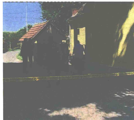
SIPA je pak uhitila sumnjivca u Brezovu Polju kod Brčkog

Osumnjičen je da je kao pripadnik Druge ozrenske brigade Vojske Republike Srpske kao čuvar u logoru "Dom Franjo Herljević" u selu Kamenica općina Zavidovići od lipnja do prosinca 1992. godine protuzakonito držao zarobljene civile