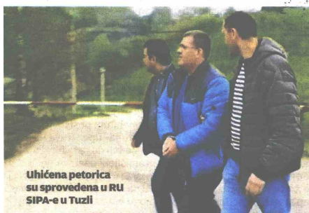
Uhićena petorica su sprovedena u RU SIPA-e u Tuzli

Tijekom pretresa je nađeno više mobitela i kartica, veća količina novca