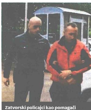
Zatvorski policajci kao pomagači