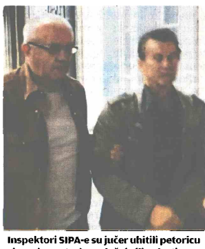
Inspektori SIPA-e su jučer uhitili petoricu zbog zloupotrebe položaja ili ovlasti