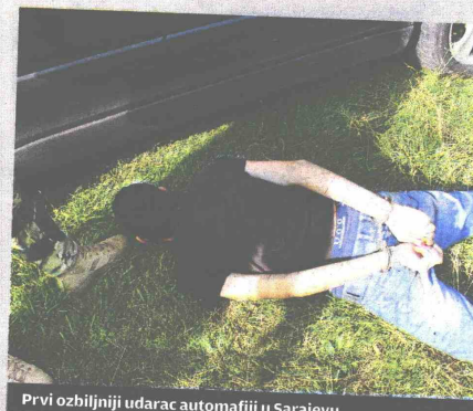
Prvi ozbiljniji udarac automafiji u Sarajevu