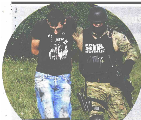
Sumnjivci se nisu stigli ni oduprijeti specijalcima

AKCIJA Agencije za istrage i zaštitu BiH na području Sokoca