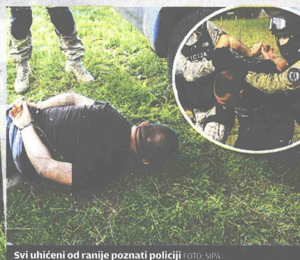
Svi uhićeni od ranije poznati policiji