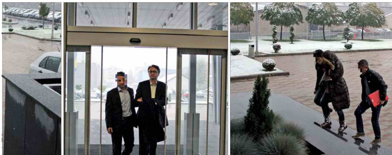
Uhapšeni obrađeni u prostorijama SIPA