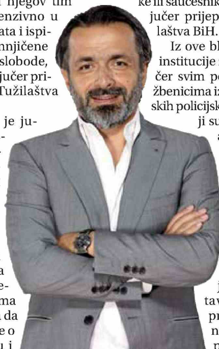
Kučuku pretresen stan

akciji, kao i kolegama iz Slovenije, Austrije i Hrvatske, koji su pružili međunarodnu pravnu pomoć u ovom predmetu. Najavljen je i nastavak istrage u pravcu podizanja optužnice protiv osoba odgovornih za