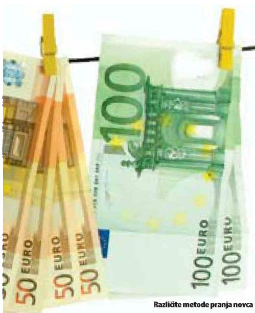
Različite metode pranja novca