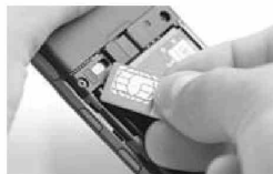
Мобилни и СИМ картице