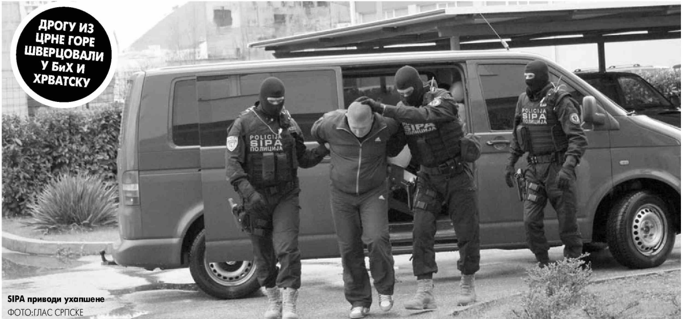
SIPA приводи ухапшене