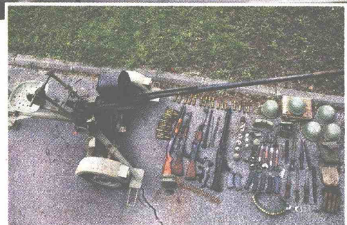
► Oružje koje su Trifunovići skrivali