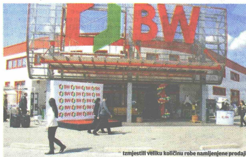
Izmjestili veliku količinu robe namijenjene prodaji