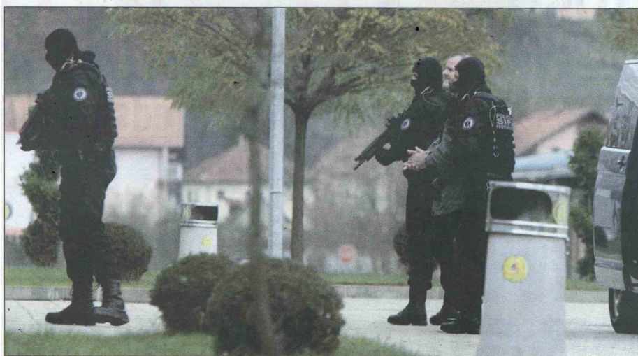
Tokom jučerašnjeg privođenja uhapšenih u prostorije SIPA-e: Dvojica predata Tužilaštvu BiH