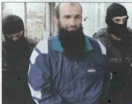
Prikupljeni dokazi da nezakonito posjeduju naoružanje