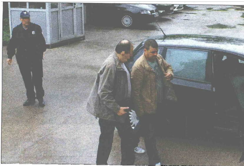
Jedan od privedenih u akciji „Pandora