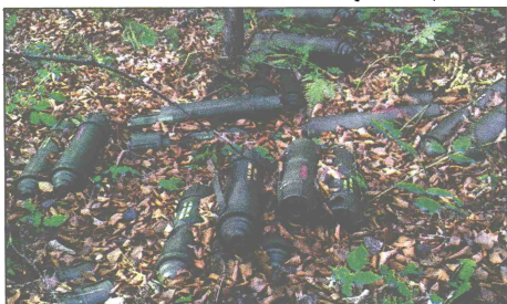
Granate za bezstrajni top