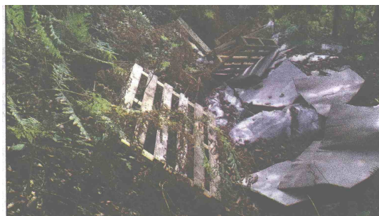
Nove palete i najloni: Granate izbačene iz kamiona