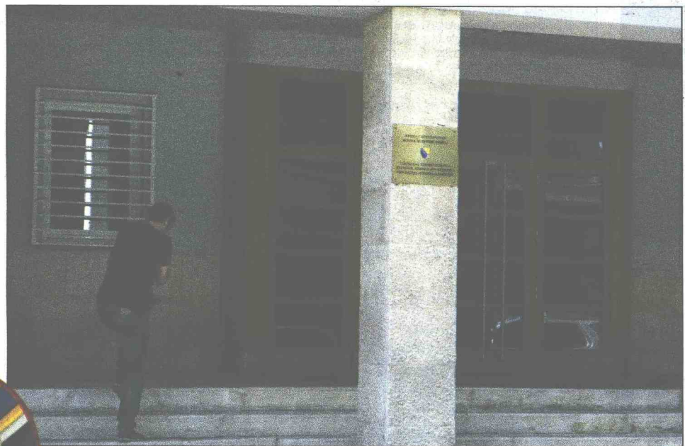
Sjedište CIK-a: Je li bilo nepravilnosti