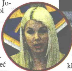
JOZIC: Službenici na terenu