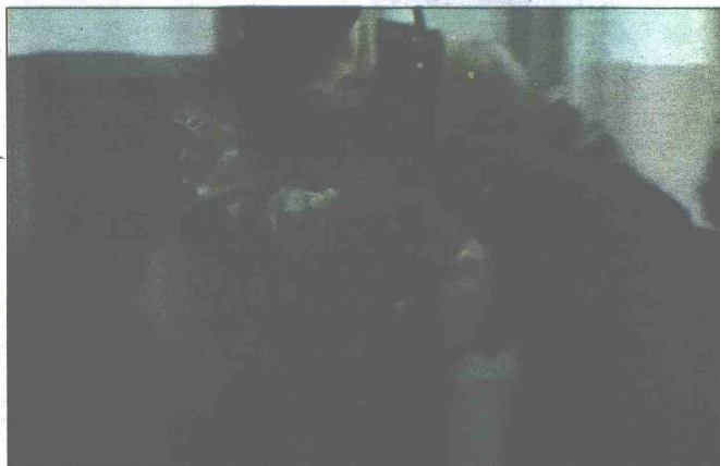
Akcija SIPA-e provedena na području Banje Luke i Mostara