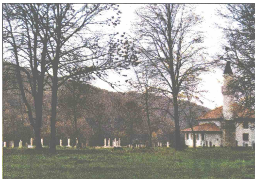
Rakitnica: U etničkom čišćenju ubijena 63 civila