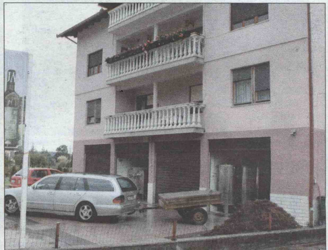
U Jerkovoju kući, navodno, samo roditelji

Tužilaštvo BiH predložilo je Sudu Bosne i Hercegovine određivanje jednomjesečnog pritvora za sedam osoba uhapšenih u akciji Agencije za istrage i zaštitu (SIPA) kodnog naziva „Brend“.