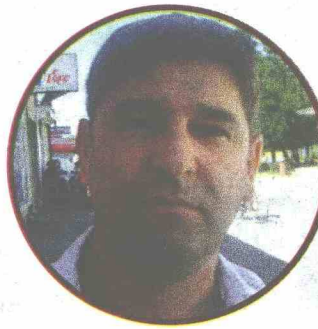
KARIĆ: Jedini saslušan