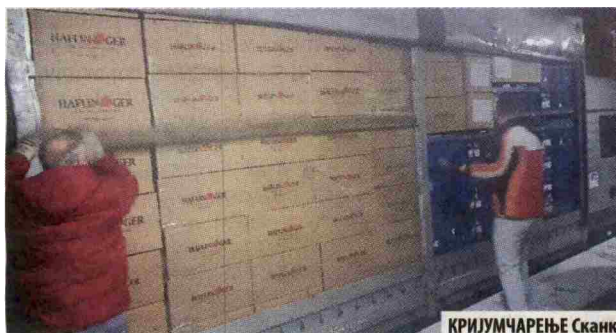
КРИЈУМЧАРЕЊЕ Сканк у кутијама с обућом