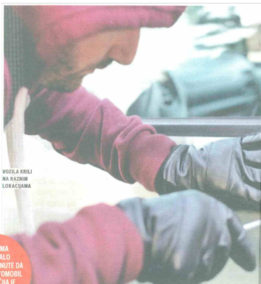
VOZILA KRILI NA RAZNIM LOKACIJAMA