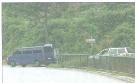
Pripadnici SIPA -e kontroliraju taksi vozilo