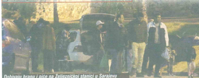
Dohivaju hranu i piće na željezničkoj stanici u Sarajevu

Sarajevo. Pokazuje to i primjer dvojice Sirijaca koji su jučer potražili pomoć čak i od ekipe „Avaza“ da ih preveze u Hrvatsku?!