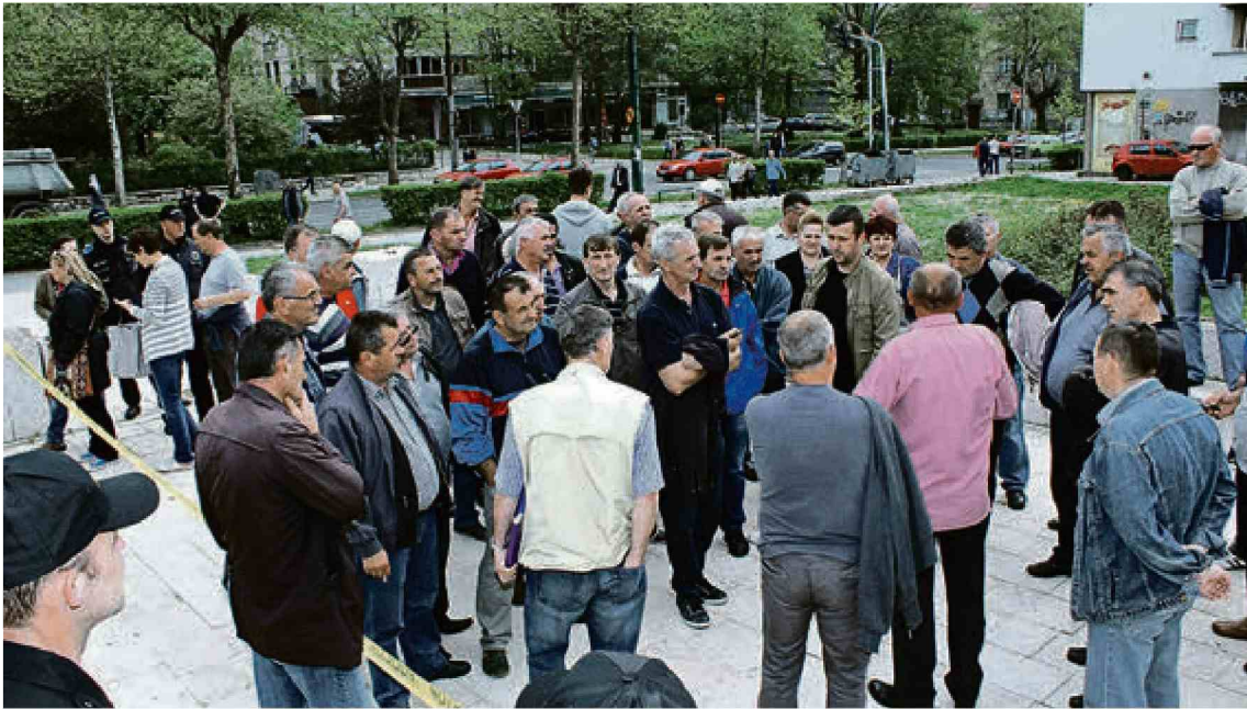
Radnici su više puta tražili prava pred zgradom Vlade FBiH / BENJAMIN BEŠIĆ