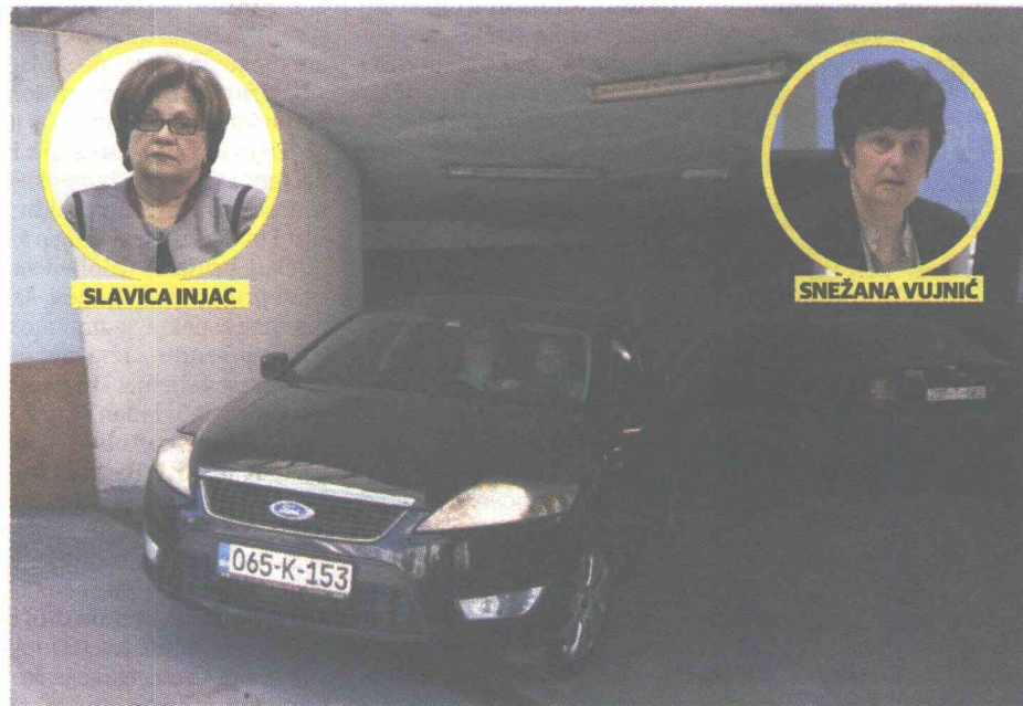
SPORNE TRANSAKCIJE BOBAR BANKE SIPA privodi direktorku Agencije za bankarstvo

Portparolka SIPA Kristina Jozić rekla je da se uhapšeni sumnjiče za više krivičnih djela, među kojima su organizovani kriminal u vezi sa krivičnim djelima zloupotreba položaja ili ovlašćenja, zloupotreba ovlašćenja u privredi, pranje novca, falsifikovanje ili uništavanje službene isprave, neprijavlivanje pripremanja krivičnog djela i falsifikovanje ili uništavanje poslovnih ili trgovačkih knjiga ili isprava.