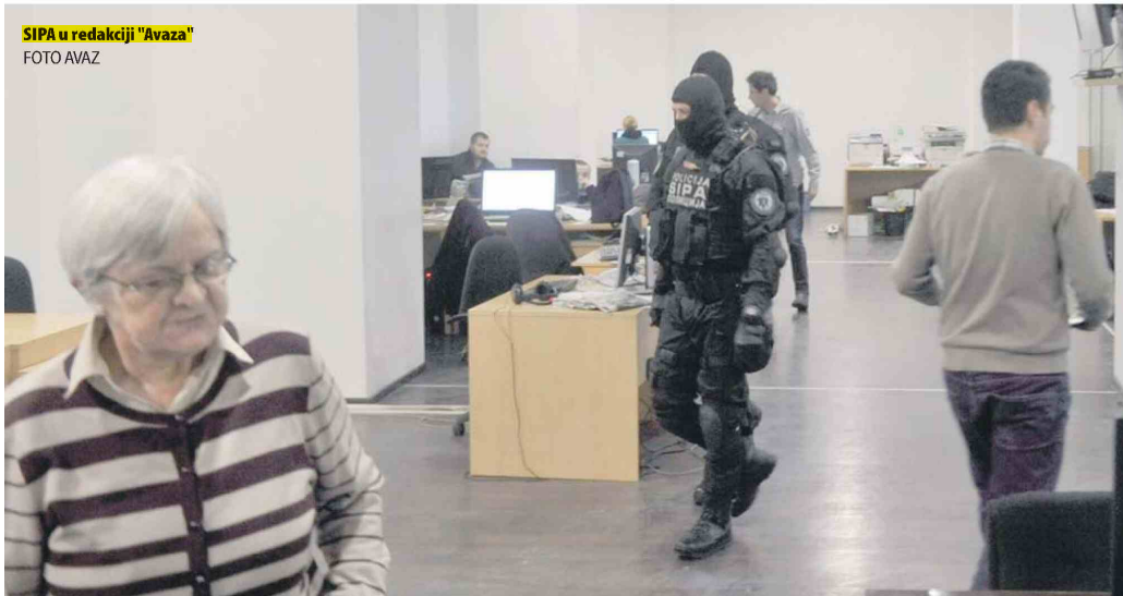
SIPA u redakciji "Avaza"