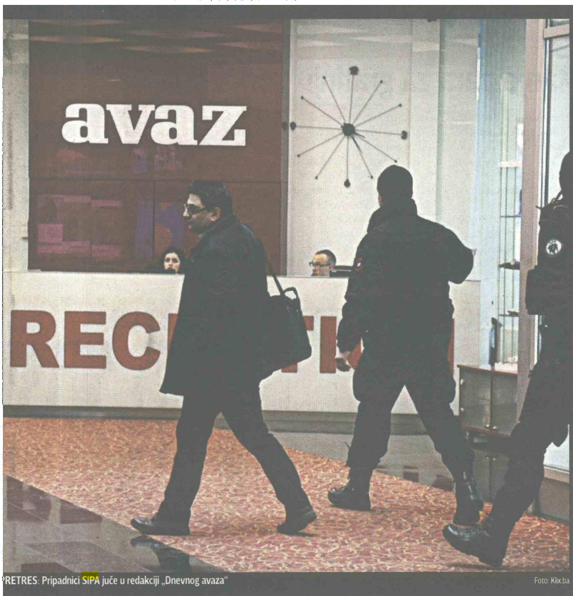
RETRES: Pripadnici SIPA juče u redakciji „Dnevnog avaza“

Nasera Keljvendija je 6. maja 2013. uhapsila kosovska policija na osnovu međunarodne poternice koju je raspisala BiH. On nije izručen u BiH zato što ne postoji sporazum o izručenjima sa Kosovom. On se nalazi i na crnoj listi SAD i poternici interpol, na kojoj je označen kao jedan od najopasnijih narko-dilera na Balkanu.