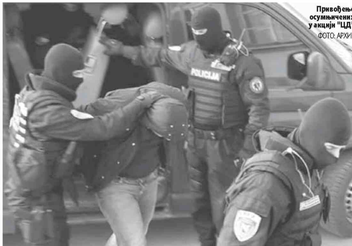
Привођење осумњачених у акцији "CD"