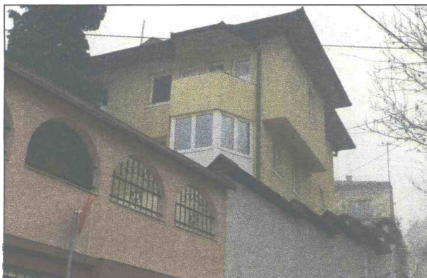
Uhapšen u svojoj kući u starom dijelu Sarajeva