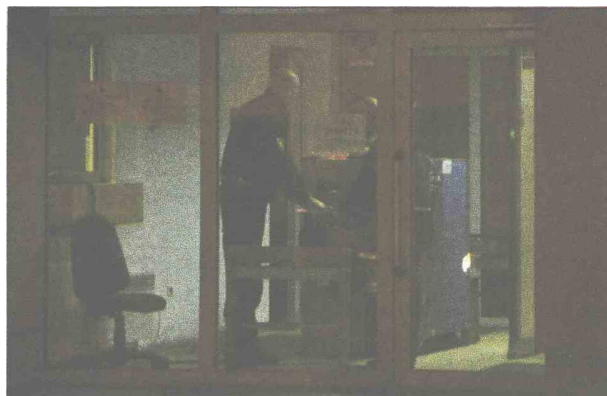
Sin Adin satima čekao odluku Tužilaštva BiH

SARAJEVO SIPA uhapsila bivšeg komandanta 3. korpusa ARBiH