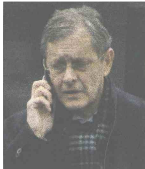
Ibrišimović: Danas ročište o pritvoru

počinili krivična djela, odnosno da su ih već počinili, ali nije ništa poduzeo kako bi spriječio zločine i kazni počinioce.