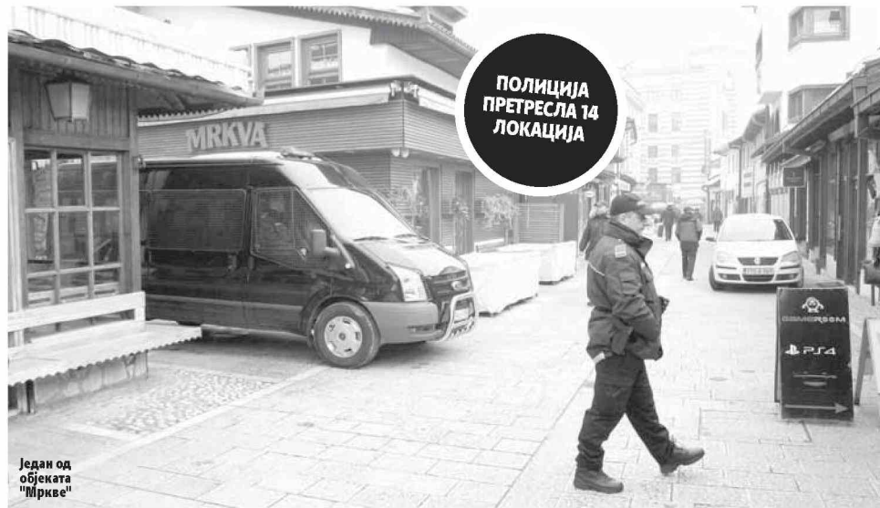
Један од објеката "Мркве"

разним малверзацијама оштећити буџет ФБиХ за око пет милиона марака. Полиција их сумњичи за кривична дјела организовани криминал, утају пореза, фалсификовање или уништење по-