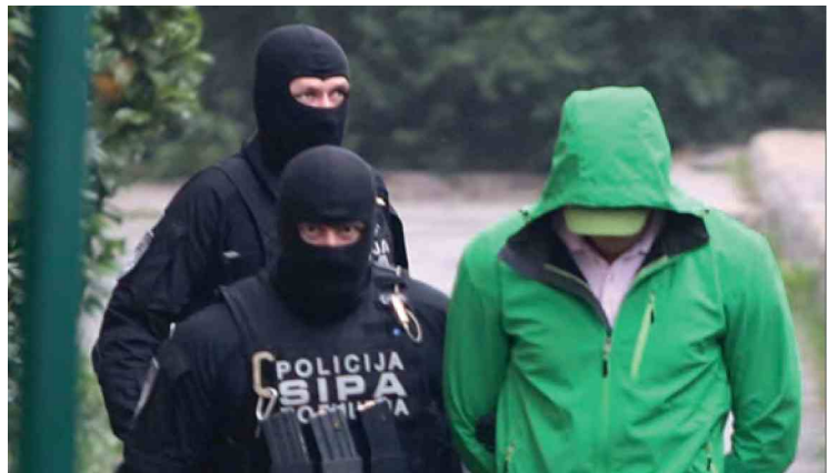
Uhapšeni su zadržani u Tužilaštvu KS-a