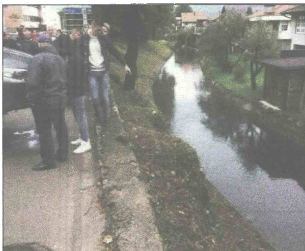
Od siline udarca vozilo odletjelo u kanal

Saobraćajna nesreća umalo završila kobnim posljedicama da nije bilo policajaca koji su odmah pritekli u pomoć unesrećenima