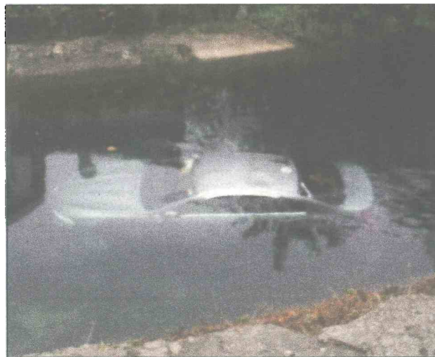
Automobil iz kojeg su policajci spasili unesrećene bio pod vodom

Malkić, koji inače živi u Sarajevu, a blagdane je proveo u rodnom gradu, u izjavi