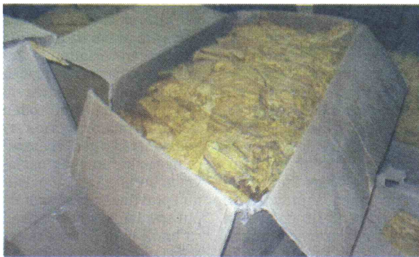
ZAPLIJENJENO 15 TONA DUVANA Izbjegli plaćanje akcize i PDV-a