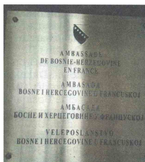
Predstavništvo BiH u Parizu