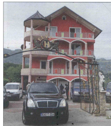
Luksuzna kuća, a niko nije zaposlen