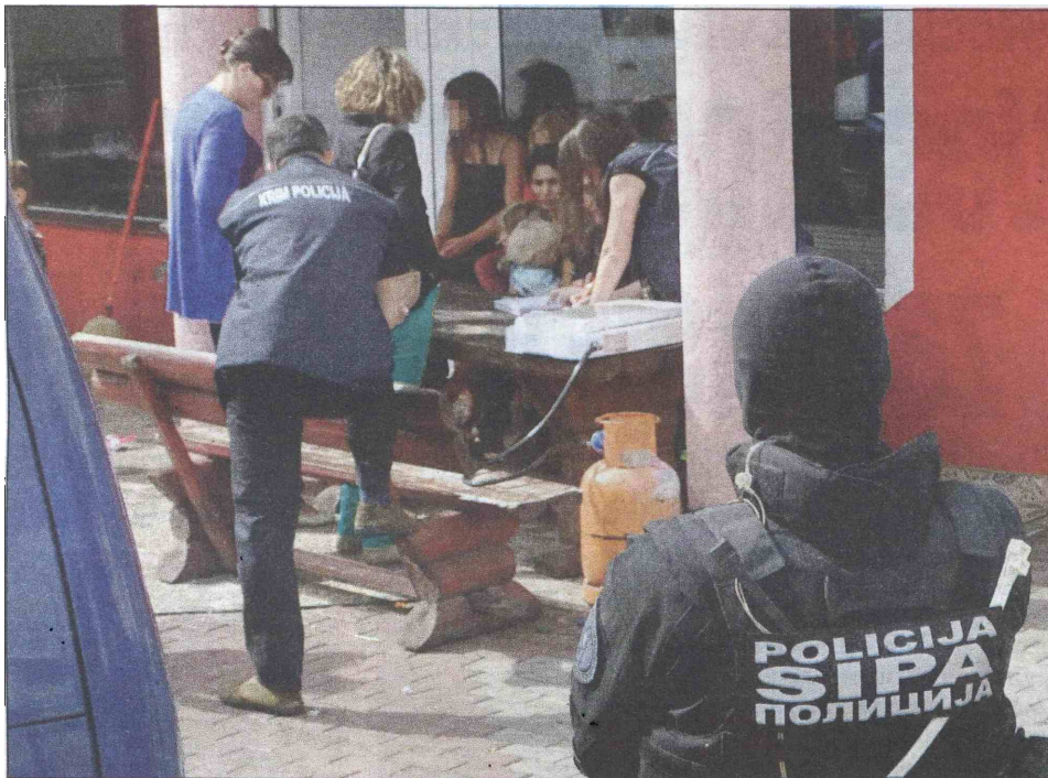
Djeca i žene zatečeni u Lukovom Polju