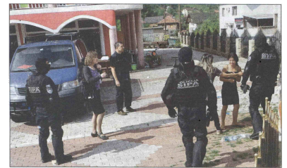
Djeca se bili zbrinjena kao potencijalne žrtve trgovine ljudima