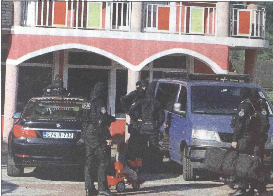
Djeca se vrtila oko pripadnika SIPA-e koji su vršili pretres objekta porodice Hamidović