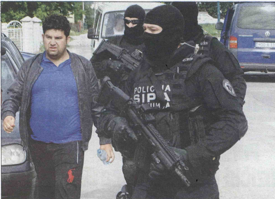
Privođenje jednog od osumnjičenih