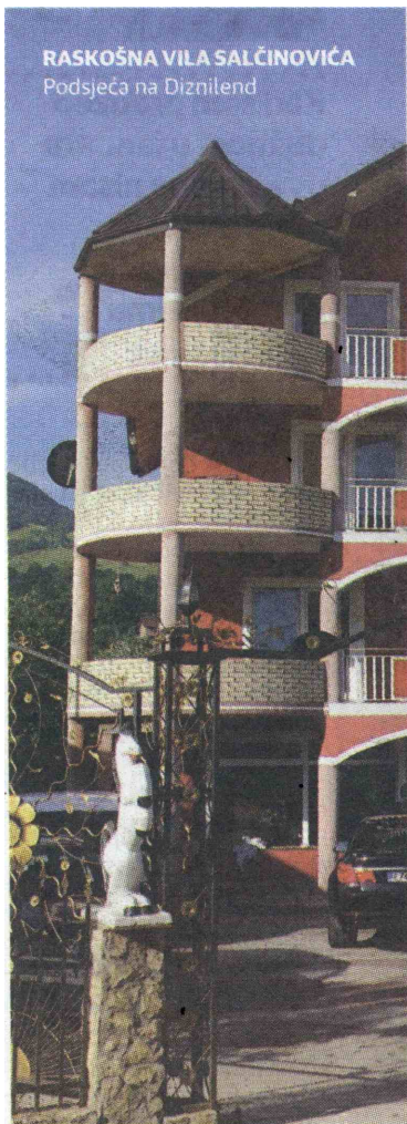
RASKOŠNA VILA SALČINOVIĆA Podsjeća na Diznilend

kretnine i luksuzna vozila u BiH. Grupu sumnjiče i za pra-