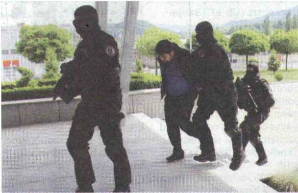
USPJEŠNA AKCIJA Privođenje osumnjičenih