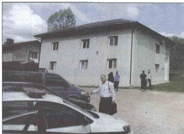
Pretnesen i mesdžid u Miljanovcima

struktura pretresli su i mesdžid u Gornjoj Dubnici nadomak Kalesije, objekta u kojem se okupljaju članovi