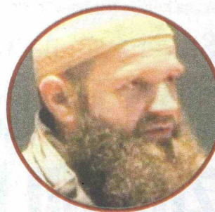
IMAMOVIĆ: Ideolog i vođa radikala u BiH