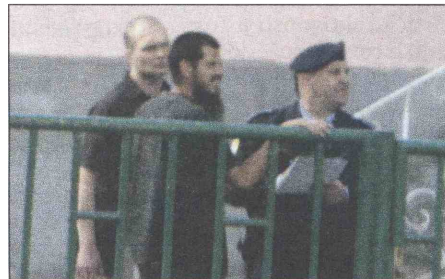
Pripadnici SIPA-e obavili niz saslušanja

Neki od njih dovezli su se privatnim automobilom praćeni vozilom pod rotacijom, ali nisu ulazili u zgradu, nego su mahali nekome ko se nalazio u objektu. A. A.