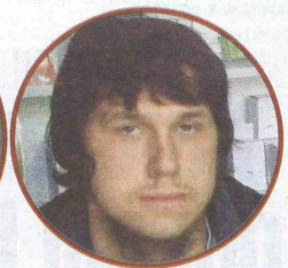
HASANOVIĆ: Hapšen i prošle godine