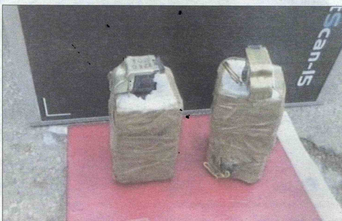
Improvizirane eksplozivne naprave pronađene u vozilu

Prema nezvaničnim informacijama, eksplozivne naprave su naručene iz Holandije, a policijske agencije BiH su saradivale s kolega-