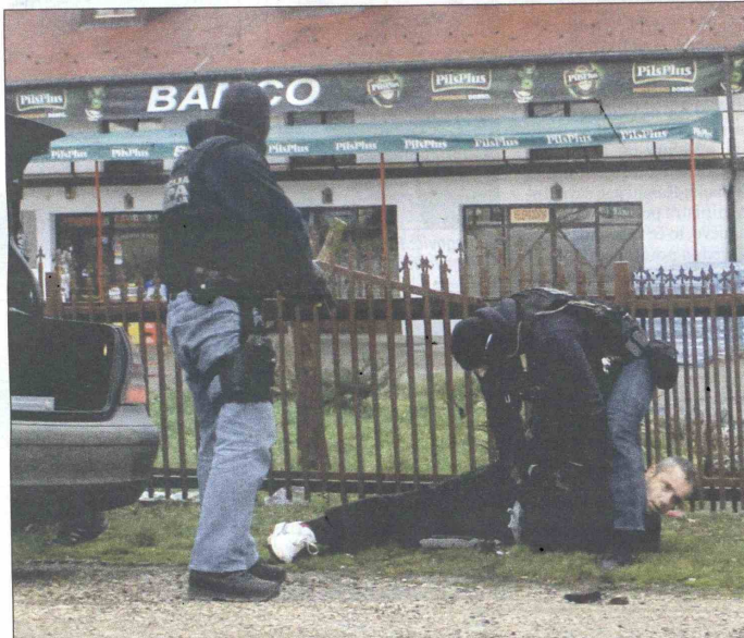
Hapšenje u Bosanskom Brodu: Bh. specijalci izveli hitru akciju