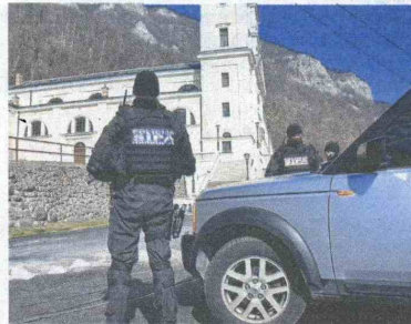
Pripadnici SIPA-e u obilasku vrijednih eksponata Samostana

u kontekstu navodnih prijetnji upućenih samostanu posljednjih dana. Policijski službenici SIPA-e ponudili su svaki vid podrške i stavili do znanja da Agencija stoji na raspolaganju da u okviru svojih nadležnosti reagira u slučaju ugrožavanja sigurnosti ljudi ili imovine. U tom cilju, SIPA će u koordinaciji sa MUP-om Zeničko-dobojske županije intenzivirati prikupljanje obavještajnih saznanja i informacija o mogućem ugrožavanju sigurnosti samostana i vrijednih eksponata koji se u njemu nalaze.