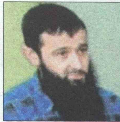
Podbićanin: Bio na čelu „El-Furkana“

On se u Siriji borio na strani terorističke organizacije Islamske države (IS), a bio je poznat kao vođa organizacije „El-Furkan“ iz Srbije. Prije dvije godine, zbog optužnice za terorizam u Srbiji, pobjegao je u Gornju Maoču, a uoči odlaska na